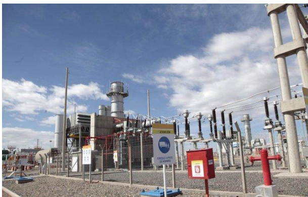
Loma Campana I

Loma Campana I y II se localizan, cercana a la ruta provincial 17 km 12, en Añelo, Provincia de Neuquén, Argentina, en el corazón de uno de los Yacimientos de producción de petróleo no convencional más destacados de la Argentina, denominado Loma Campana.