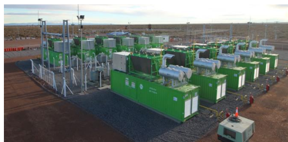
Loma Campana Este

Las Centrales Térmicas Loma Campana se inauguraron en noviembre de 2017.