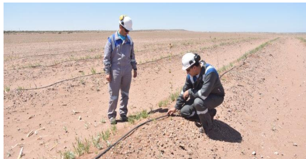
Cuidado del Pulmón Verde

En YPF Luz entendemos que la sustentabilidad requiere un trabajo responsable, que concilie el desarrollo de nuestro negocio y la generación de rentabilidad para nuestros accionistas, con la creación de valor para las comunidades adonde operamos, y que busque minimizar el impacto ambiental de todas nuestras operaciones.